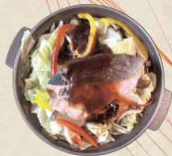
ちゃんちゃん焼き定食

標津産の鮭をステーキにし、サラダと特製レモンバターソースを添え洋風仕上げのランチで大人気のメニューです。