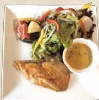
サーモンステーキ定食