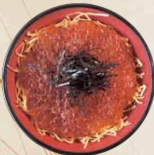
しべつ産鮭のいくら丼