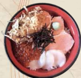
しべつ鮭親子三代漬丼